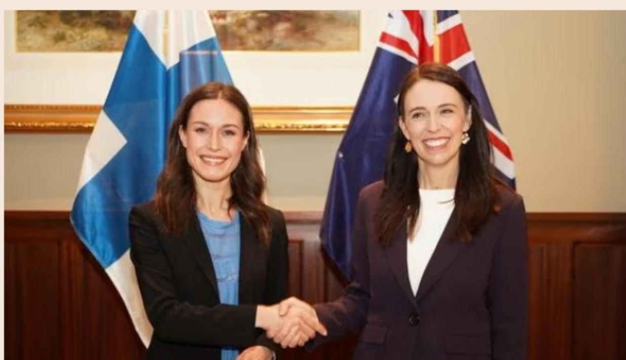
Jacinda Ardern, la ex primera ministra de Nueva Zelanda y a su homóloga, la primera ministra de Finlandia, Sanna Marin

Hay cuatro veces más referencia a la familia cuando se aborda el tema de mujer y empresa que cuando se trata la misma cuestión respecto de los hombres. Es como una suerte de recordatorio de que si bien las mujeres hoy tienen una vida pública, hay un rol primario que deben atender, lo que no ocurre en la misma medida con los hombres a quienes por ejemplo, es muy raro que se les pregunte sobre sus estrategias para conciliar su vida familiar y laboral.